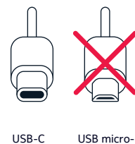
USB-C USB micro-B

Чтобы включить телефон, нажмите клавишу питания и удерживайте ее нажатой, пока телефон не завибрирует. Телефон поможет выполнить настройку.